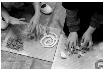
粘土での版づくり