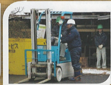
小型フォークリフト (1t未満) 特別教育