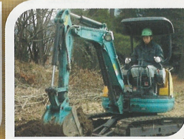
小型車輻系建設機械 (3t未満) 特別教育