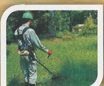
刈払機取扱作業者 安全教育