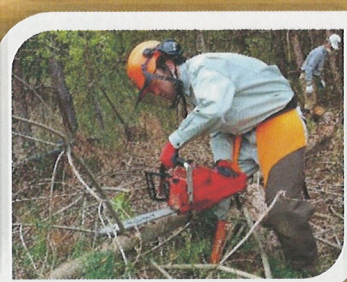
チェーンソー特別教育